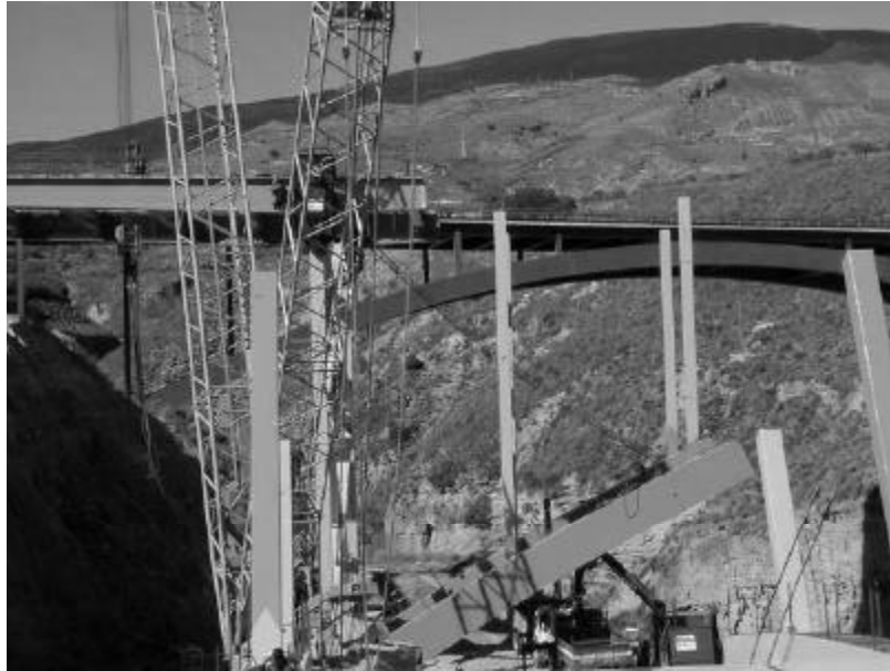
Colocación de la primera diagonal.