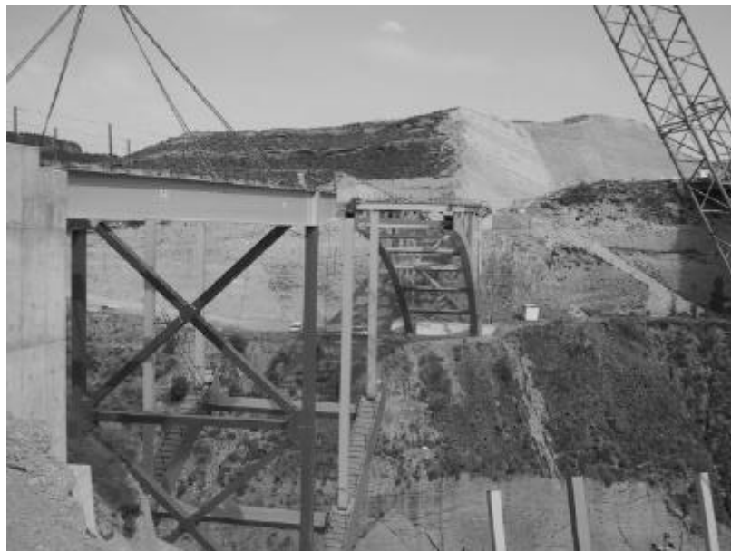
Colocación de piezas del tablero. Al fondo un voladizo ya construido.

Este puente lleva asimismo una instrumentación definitiva, cuya finalidad es contrastar las acciones térmicas, eólicas y sísmicas que propone la instrucción IAP. La instrumentación, consistente en 2 anemómetros, 2 acelerómetros y diversos sensores de temperatura quedará en funcionamiento un periodo mínimo de dos años.