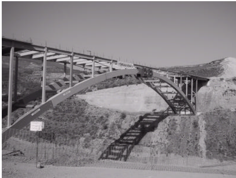
Estructura metálica del puente ya montada.